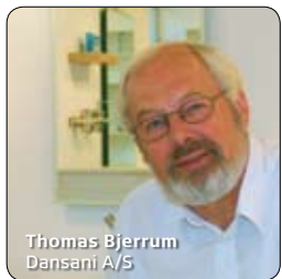
Thomas Bjerrum Dansani A/S

"Hvis troen på projektet er stærk nok, kan imperier bygges og krige vindes. If you can dream it, you can do it."