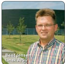
Bent Jensen Linak A/S

"Det vigtigste er troen på at det lykkes blandet med en god portion mod og stædighed."