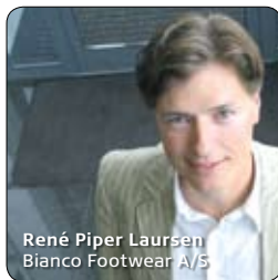
René Piper Laursen Bianco Footwear A/S