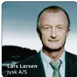
Lars Larsen Jysk A/S

"Viden krydret med visioner, vilje og vovemod – tilsat familiens opbakning samt god forberedelse. Det er kilden til succes."